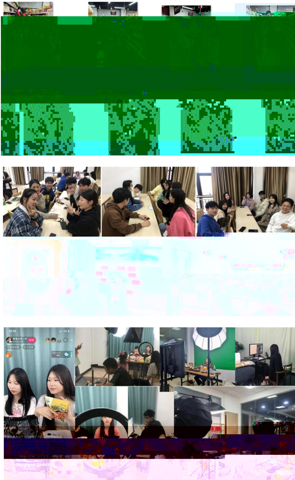
图 组织学生开展实习实训