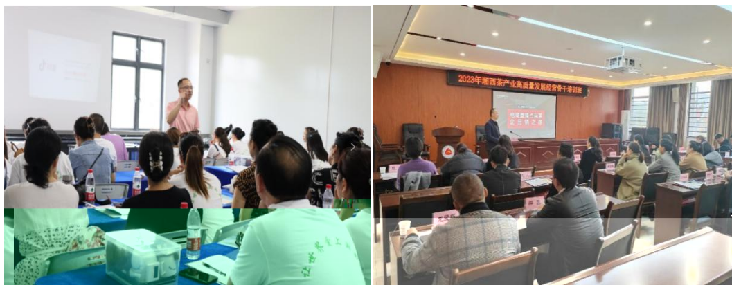
图 企业协助学校为湘西茶企开展电商直播培训

更 对 电 的 。 过 的 ， 茶 得 更 地 电 播的操 、 策 等方 的 ， 电 的 奠定 础。