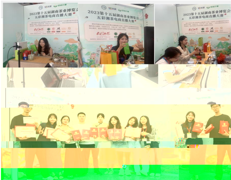
图 “湖南省第十五届茶博会” 电商直播比赛现场

播和方的，短 得的步。 队比10多单、单， 包但不、等多个，的 和队得的高度。的 得不对公的，更对参 付出和的充分定。